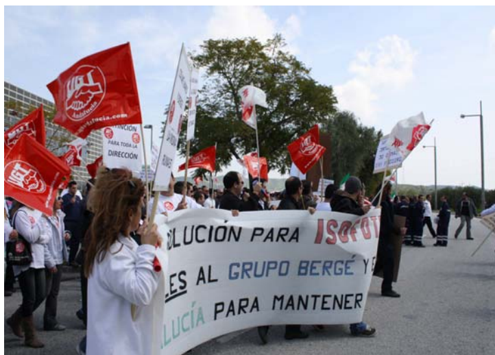
Los empleados recorrieron con una pancarta las calles del PTA.