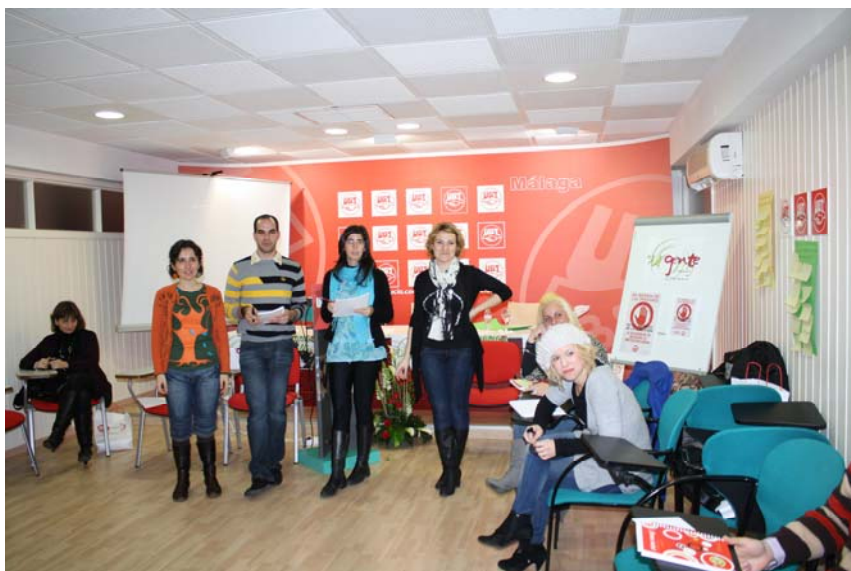
Primera asamblea de Surgente celebrada este año en la sede de UGT Málaga.