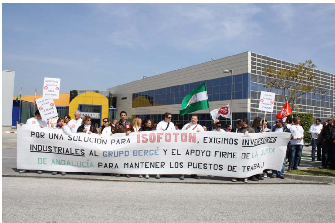
Trabajadores de Isofotón se concentran frente a la puerta de entrada de la empresa.