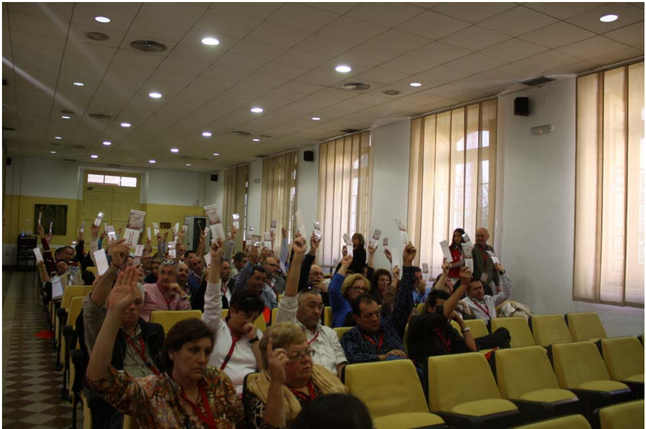
Un momento de la votación de unos de los puntos del orden del día del comité.

sitivamente. El secretario de Administración de UGT Málaga señaló que “se trata de unos presupuestos muy ilusionantes porque dejamos limpias las deudas y empezamos a hacer inversiones y también a hacer una UGT más grande”.