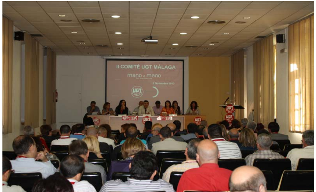
Asistentes a la celebración del II Comité Provincial de UGT Málaga celebrado el pasado 5 de noviembre.