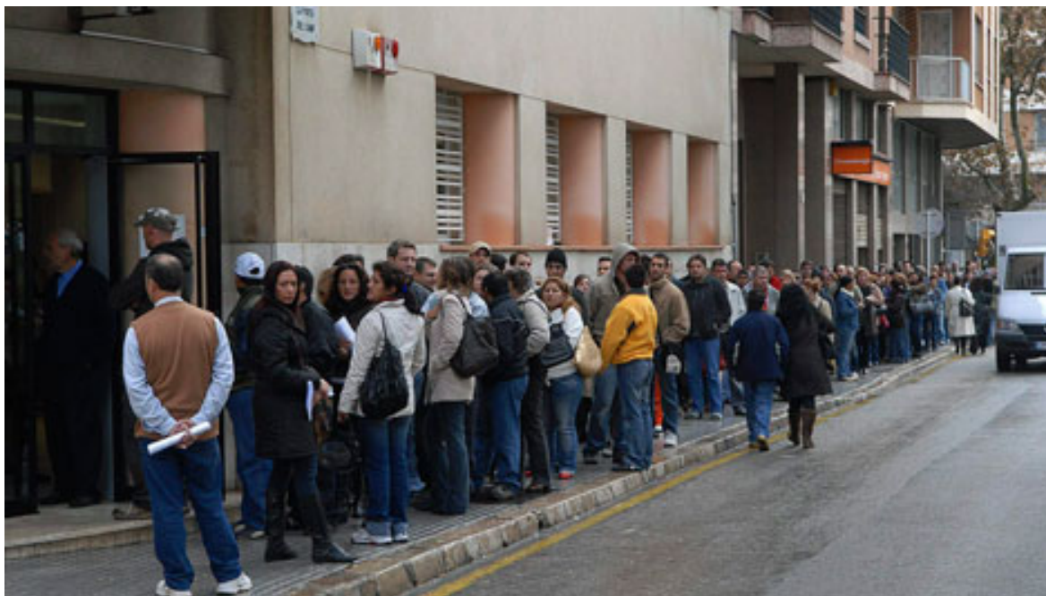
Inmensa cola de parados en Málaga, provincia española que registró en octubre el mayor aumento de desempleados.