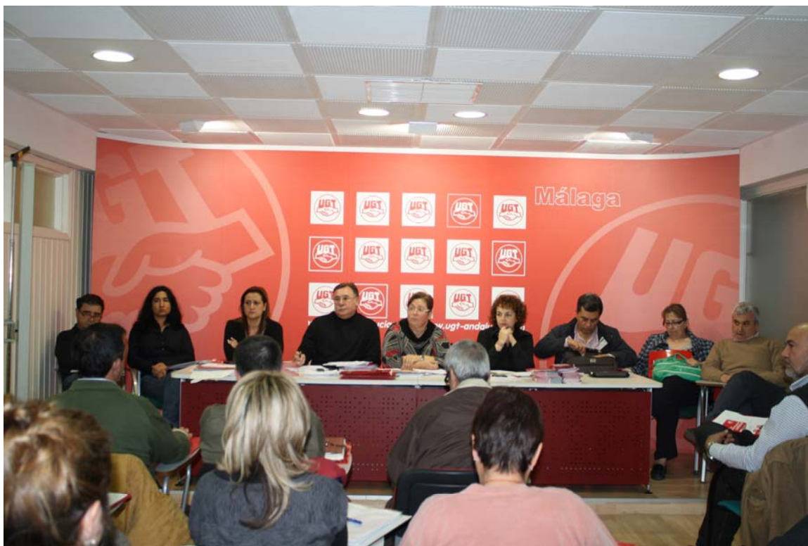
Consejo de la Federación de Servicios Públicos (FSP) de UGT Málaga.

Bien es cierto que la Administración de la Junta de Andalucía lleva muchos años sin norte, en lo que a organización del trabajo se refiere, y también es cierto que desde hace años la UGT viene reivindicando la necesidad de reorganizar los entes instrumentales.